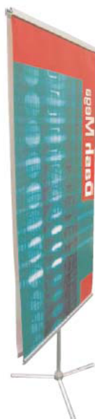
Dash Mega Recto-Verso (nécessite un 2ème jeux de rails en option).

Il permet d'ajuster la hauteur des visuels jusqu'à 2,40 mètres .